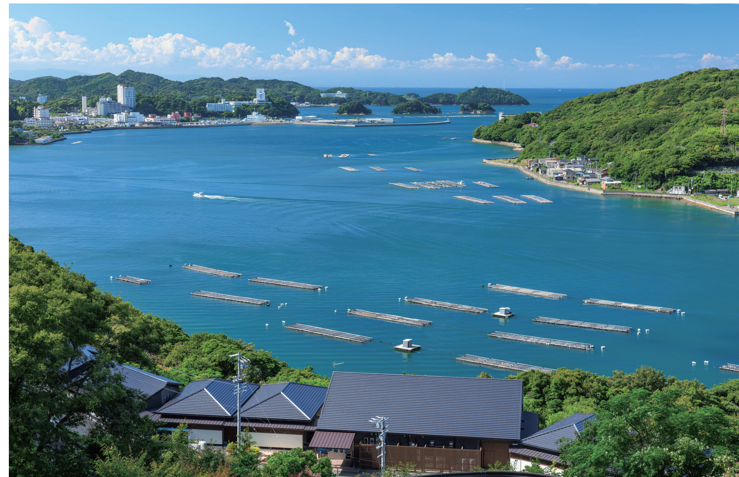
写真：【鳥羽湾】新緑に染まる鳥羽湾